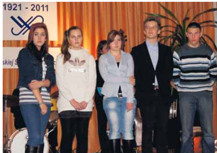
Nagrodzeni w konkursie wiedzy o WSM.

Okazało się jednak, że to nie był ostatni, poza słodkim poczęstunkiem, punkt programu. Wszyscy zaproszeni goście przed rozpoczęciem uroczystości otrzymali numerki. Dopiero na końcu okazało się, że