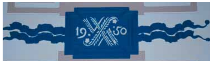
Napis nad wejściem do sali kolumnowej w SDK.

charakterze kulturalno-oświatowo-wychowawczym. Wymienił działające w SDK organizacje społeczne, które są z nim historycznie związane: Koło Grodnian im. E. Orzeszkowej, Klub Byłych Więźniów Obozu Koncentracyjnego w Neuengamma, Klub Żołnierzy i Rodzin 30. Pułku Strzelców Kaniowskich, Ognisko TKKF. Pomieszczenia są wynajmowane stałym użytkownikom i okazjonalnym, m.in. Urzędowi Dzielnicy Żoliborz – w tym ostatnim przypadku po wyjątkowo promocyjnej cenie. Wpływy za wynajmem stanowią źródło utrzymania