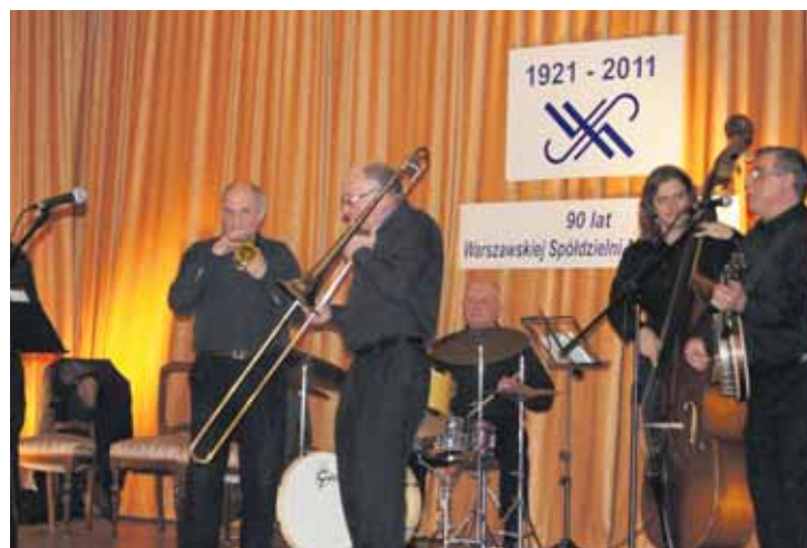
Zespół Old Timers.