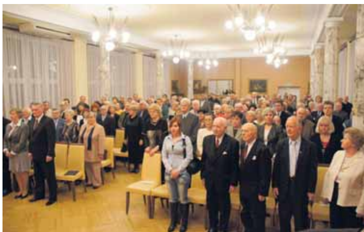
Zespół Old Timers odegrał hymn spółdzielców.