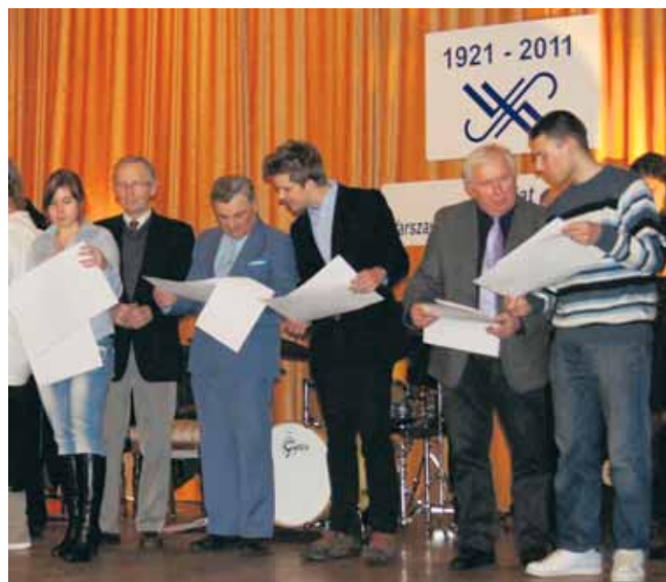
Nominowani do nagród w konkursie wiedzy o WSM musieli skorzystać z pomocy spółdzielczych znawców.