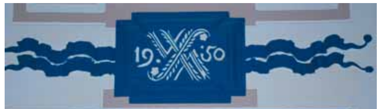
Napis nad wejściem do sali kolumnowej w SDK.

charakterze kulturalno-oświatowo-wychowawczym. Wymienił działające w SDK organizacje społeczne, które są z nim historycznie związane: Koło Grodnian im. E. Orzeszkowej, Klub Byłych Więźniów Obozu Koncentracyjnego w Neuengamma, Klub Żołnierzy i Rodzin 30. Pułku Strzelców Kaniowskich, Ognisko TKKF. Pomieszczenia są wynajmowane stałym użytkownikom i okazjonalnym, m.in. Urzędowi Dzielnicy Żoliborz – w tym ostatnim przypadku po wyjątkowo promocyjnej cenie. Wpływy za wynajmem stanowią źródło utrzymania