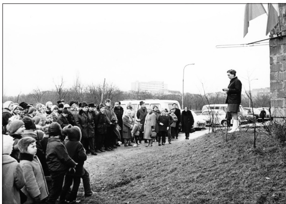
Uroczystość nadania ulicy Tołwińskiego (25 II '71)

Na razie nie ustalono jeszcze terminu rozprawy dotyczącej żoliborskiego spółdzielcy. Jak się dowiedzieliśmy w WSA, posiedzenia w sprawie wszystkich ulic będą miały miejsce w maju i czerwcu. W Gdańsku rozprawy już się odbyły, sąd uchylił wszystkie zarządzenia wojewody pomorskiego. Patrząc