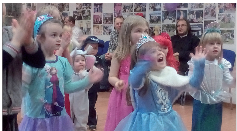
W Klubie „Szafir” nigdy nie wieje nudą