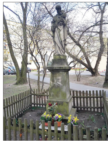
Kapliczka na Rudawce

Ze względu na to, że sprawa podjęcia jakichkolwiek prac konserwatorskich była skomplikowana, gdyż Spółdzielnia nie była właścicielem figury, która jedynie znajduje się na gruncie w użytkowaniu wieczystym WSM, nie wiadomo było, kto prawnie odpowia-