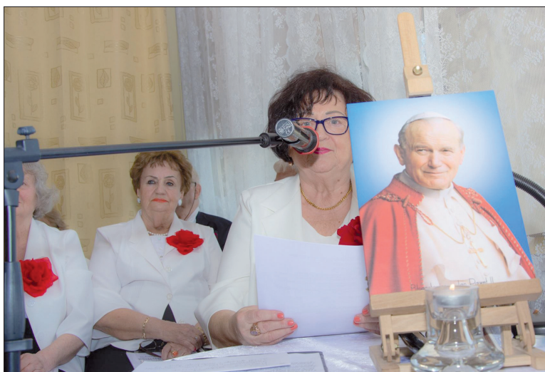
Koncert Papieski