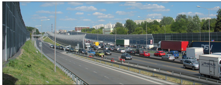
Droga dojazdowo-rozprawdzająca, mogąca służyć osiedlu