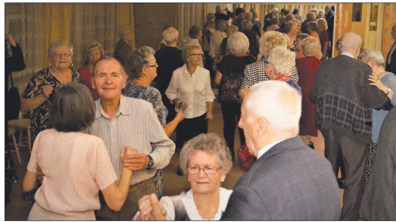
Tańce w trakcie wieczoru seniora

Kolejnym zadaniem, które stanęło przed organizatorami życia społeczno-kulturalnego w osiedlu Piaski było przygotowanie spotkania se-