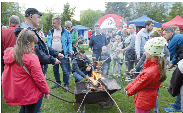
Ognisko rozpalono na taczce

Wrzesień nie rozpieszczał nas pogodą, jednak 23 września, w dniu Pikniku Sąsiedzkiego na Wawrzyszewie, zaświeciło słońce. Pomysłodawcą nowej serii pikników, z których pierwszy odbył się na Piaskach, jest Stowarzyszenie Razem dla Bielany.