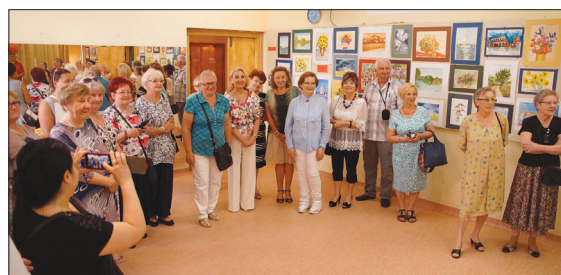
Wernisaż po pierwszym etapie warsztatów

O tym, że w Klubie Piaski „dzieje się... dzieje” większość z nas wie i czuć chyl, ale tego jeszcze nie było: warsztatów malarstwa akwarelowego.