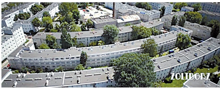
Kadr z filmu

Trzy lata musieliśmy czekać zanim dokument Olgi Malinowskiej o powstaniu Warszawskiej Spółdzielni Mieszkaniowej trafił do telewizji. 13 października widzowie TVP Kultura mogli obejrzeć film „Szklane domy. Historia osiedli społecznych”. Półgodzinny program jest już dostępny dla każdego na stronie vod.tvp.pl .