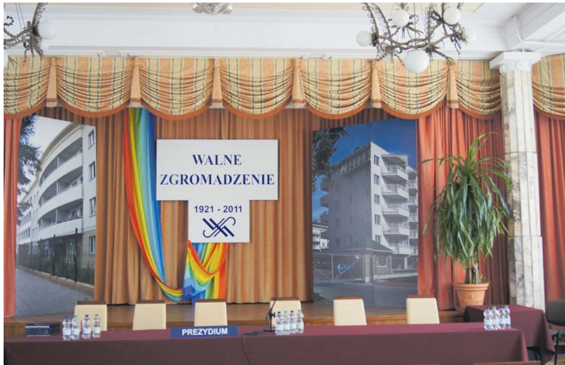
Sala obrad Walnego Zgromadzenia

Tegoroczne, podzielone na sześć części, Walne Zgromadzenie Członków Warszawskiej Spółdzielni Mieszkaniowej, było zebraniem wyjątkowym, które zapewne przejdzie do historii z kilku istotnych powodów.