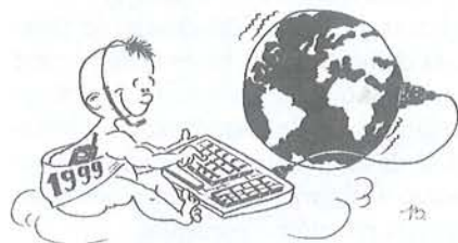
Rys. Bożena Jakubowska