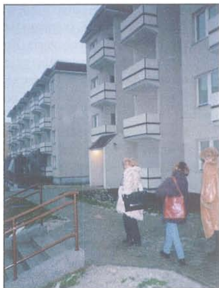
Na pierwszym planie budynek gotowy do zasiedlenia jeszcze przed nowym rokiem. W głębi budynek, w którym trwają prace wykończeniowe, ale już wkrótce i tu wprowadzą się nowi mieszkańcy.

W tej chwili w Nowodworach przy ul. Ciołkosza jest 5 bloków, w których mieszkają lokatorzy. Szósty jest w trakcie zasiedlania. W 252 mieszkaniach toczy się codzienne życie lo-