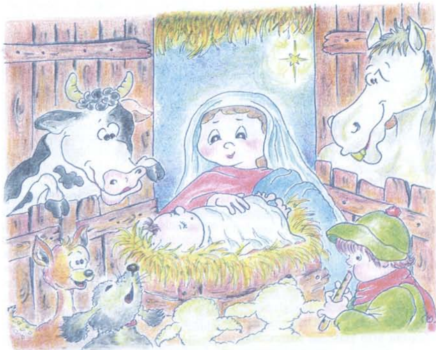
Rys. Bożena Jakubowska

W XVII i XVIII wieku szeroko praktykowano odwieczny zwyczaj dawania i przyjmowania prezentów. tzw. kolędy. O północy w wigilię, tak jak i dzisiaj, ruszano do kościoła na pasterkę. Większość jej uczestników znajdowała się na ogół pod wpływem wypitych trunków, a że i w tamtych czasach raczej za żołnierz nie wylewano, nabożeństwo miało zwykle w bardzo wesołym, a nawet bardzo swawolnym nastroju. Do ulubionych żartów należało ponoć nalewanie